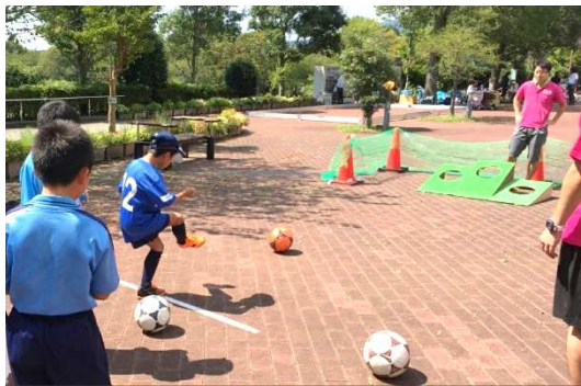
色々な催しを楽しんでもらいました

アスルクラロ沼津の誕生は、JFL参入から3年。念願のJリーグ加入が決まりました。地域活性化の起爆剤になり得るこの考えから、行政との繋ぎや地域への浸透、支援の獲得など、様々な取り組みをしてきました。今回の昇格は本当に嬉しく思います。 写真は来場された方々に楽しんでもらう目的で仲間と共に実施してきたイベントの様子です。Jリーグ参入初年度も、より多くの方々の参画を得ながら取り組みを進めていきたいと思います。