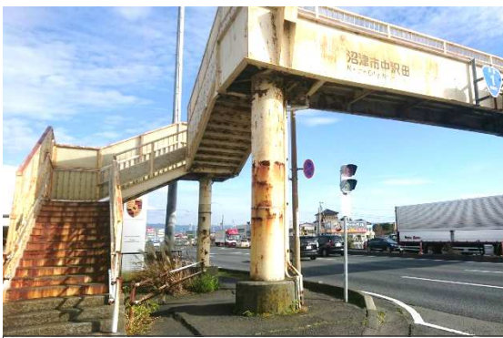
老朽化が進んでいます

高度経済成長期に整備された歩道空間の老朽化は全国的な課題です。今回設置された協議会は、全国に先駆けたモデルケースとなります。3月までに計3回実施する予定です。子供・学生・子育て世代・高齢者等、様々な視点から考えていく必要があります。声をお寄せ下さい。