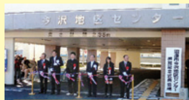
H26年12月に開館した今沢地区センター