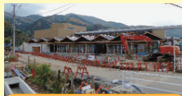
H27年4月開館予定の「くるら戸田」