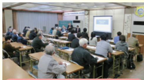
愛鷹地区センター開催時の様子

第14回(9月議会)定例会終了後の2014年10月31日(金)、11月18日(火)及び21日(金)の3日間、片浜地区センター、愛鷹地区センター、大平地区センターにおいて、市民クラブとして「議会報告会&公聴会」を開催いたしました。合計で約160名の市民にご参加いただく中、大変多くの叱咤激励を含めたご意見を賜りました。ありがとうございました。