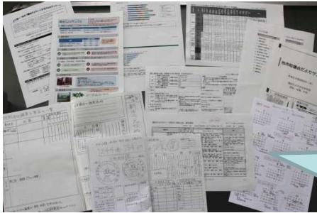
紙面リニューアルへの賛同を得るために作成した資料の一部

議会と市民とをつなぐツールの1つとして議会だよりをより良くしていきたいとの思いから自主研究会を設立し、研究の成果を委員会に提言し続けた結果、何十年ぶりの紙面リニューアルを実現しました。…とは言え、まだまだ改革は道半ばです。引き続きの調査研究と働きかけを進めています。