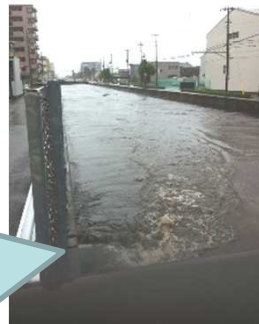
大雨時の新中川の様子

新中川は、従前より大雨が降ると氾濫し周囲への被害を及ぼしている河川です。会の設立にあたり事務局長に就任し、調査活動を進めながら、関係各所と連携して、会としての活動や行政への働きかけを行っています。