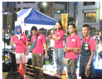
会場の全員で「乾杯！」（オクトーバービアガーデン in 沼津駅北口）