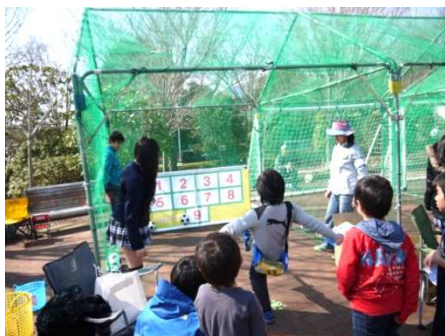
家族が休日を楽しく過ごす場の提供（アスルクラロ沼津応援フェスタ）

平成26年の初めに設立以降、沼津を含む東部地域を活性化するための事業を行っています。また地域の活性化を願う人や団体を応援する活動をしています。